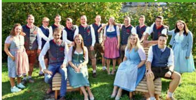
Der Bezirksvorstand für das Jahr 2024/25