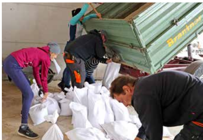
Sandsäcke füllen am Bauhof

Auch bei den Aufräumarbeiten gab es fleißige Helfer. Ein KHD (Katastrophenhilfsdienst) Zug der Feuerwehr half bei Aufräumarbeiten bei der Firma Amashauffer und die Pioniere aus Melk entfernten in mühsamer Kleinarbeit die Verkläusung an der Erlaufbrücke.