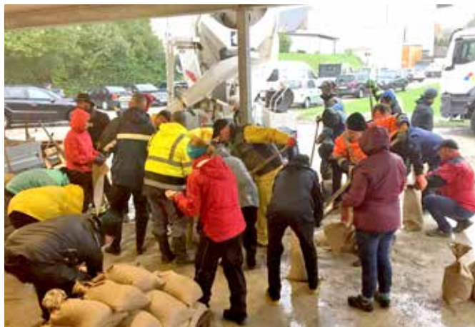
Großer Dank an die Firma Wopfinger

Am Sonntagvormittag wurde ein Trafo der EVN von den Wassermassen weggerissen. Dies führte zu allem Überfluss noch zu einem Stromausfall in einigen Teilen unserer Gemeinde. Wir bauten sehr schnell eine Notstromversorgung auf und die Mitarbeiter der Netz NÖ rückten ebenfalls sehr schnell an, um den Ortsteil Kendl mit Notstrom zu versorgen.