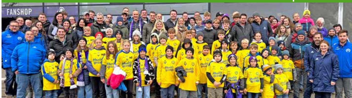
Busausflug in die Generali-Arena nach Wien