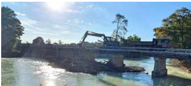
Bundesheereinsatz an der Kendler-Brücke

Vom 12. bis zum 16. September 2024 wurden Teile Niederösterreichs von schweren Regenfällen mit bis zu 500 Liter pro Quadratmeter verwüstet.