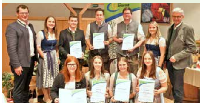
Leistungsabzeichen in Bronze