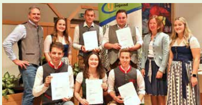
Leistungsabzeichen in Silber