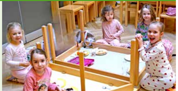
Beim „Verkehrt-Tag“ wird auf umgedrehten Tischen gejausnet.