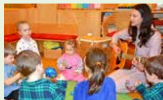
Gemeinsames Singen gegensätzlicher Liedinhalte.

Am Faschingsdienstag durften die Kinder in ihren eigenen Kostümen in den Kindergarten kommen und im gemeinsamen Spiel neue Rollen ausprobieren.