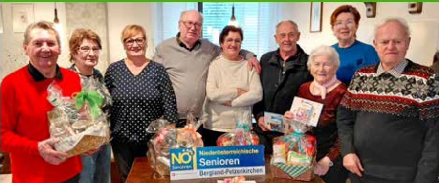
Viel Spaß beim Schnapsen.