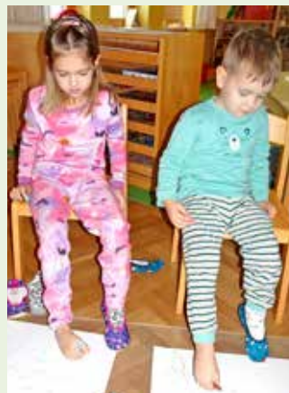
Kreatives Malen mit den Füßen.

Der „Alles-verkehrt-Tag“ am Rosenmontag, bei dem Gewohntes auf den Kopf gestellt wurde, regte kreatives Denken und Perspektivenwechsel an.