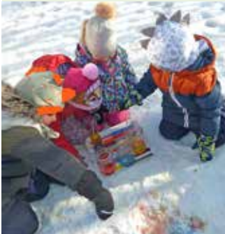
Experimente im Schnee.

BERGLAND | Im Jänner und Februar 2026 nutzten die Kindergartenkinder die winterliche Jahreszeit für vielfältige Bildungsangebote im Haus und in der Natur.