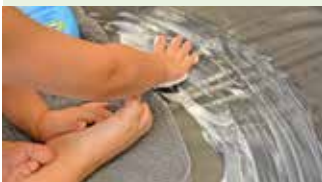
Cremerutsche – ein besonderes Angebot für alle Sinne.