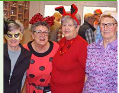
Ein gelungener Faschingsnachmittag.