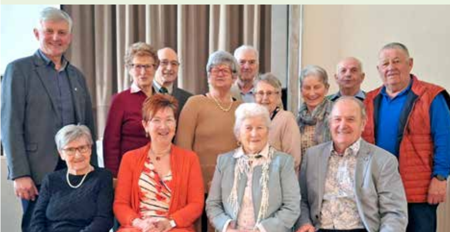
Der Vorstand wurde bei der Jahreshauptversammlung neu gewählt.