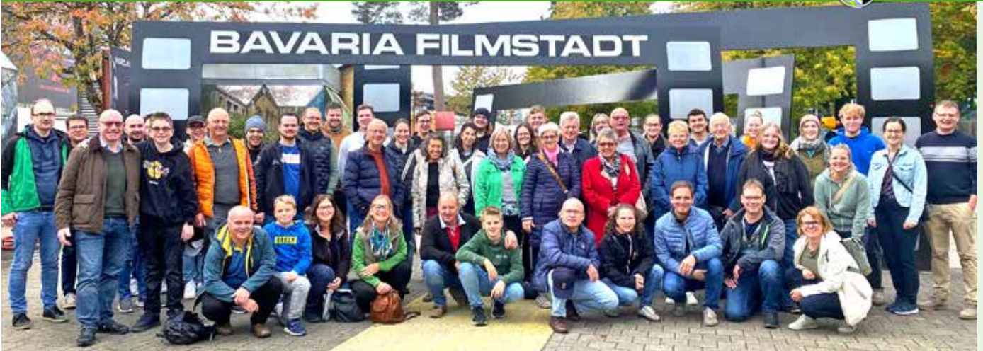
Viel Spaß beim Musikausflug zu Bavaria München

BERGLAND-PETZENKIRCHEN | Am Ende des Jahres wollen wir nochmals zurückschauen, was sich alles so getan hat in den letzten Monaten bei der Markt Musikkapelle Petzenkirchen-Bergland. Es war wie immer sehr viel los, nicht nur kameradschaftlich, sondern auch musikalisch.