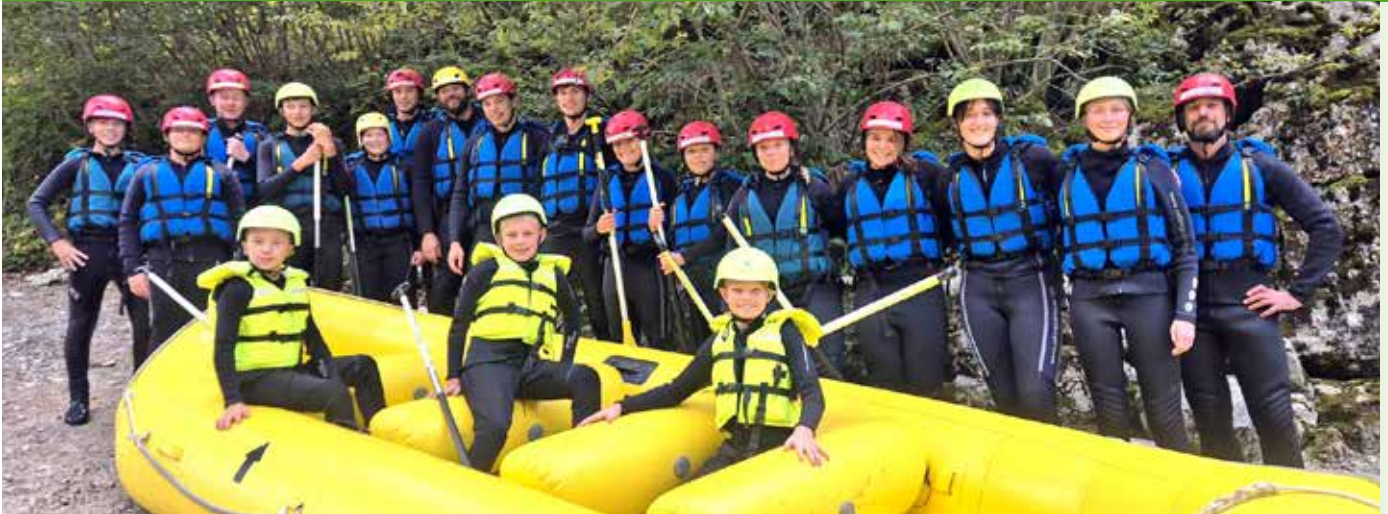
Jugendfeuerwehrausflug nach Palfau