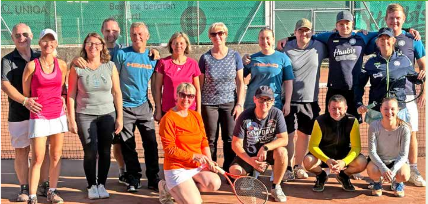
Erfolgreiche Titelverteidigung beim mixed doppel 2025

BERGLAND-PETZENKIRCHEN | Bevor unsere Tennisplätze Mitte Oktober erfolgreich eingewintert wurden, fanden im Herbst noch die letzten spannenden Bewerbe der Saison statt. Zahlreiche Spielerinnen und Spieler zeigten beeindruckende Leistungen und sorgten für hochklassige Matches – ein perfekter Abschluss einer großartigen Tennissaison 2025.